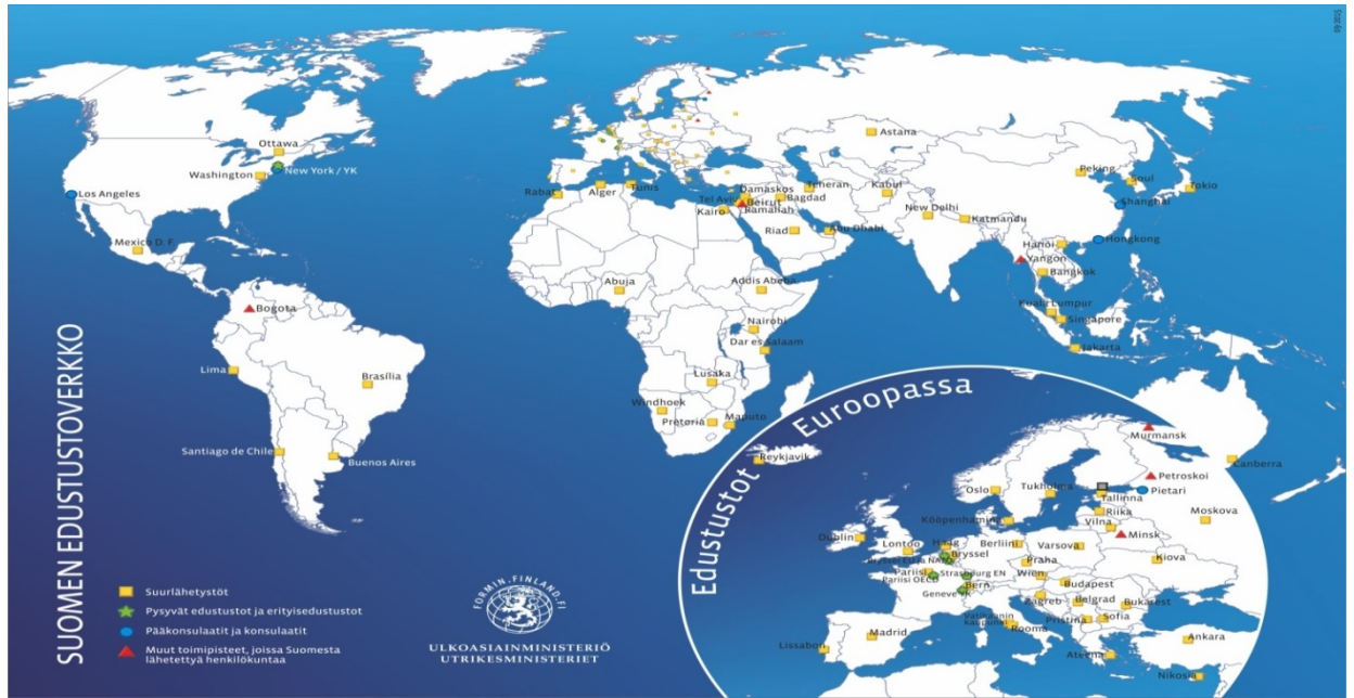
Kuvio. Suomen edustustoverkko